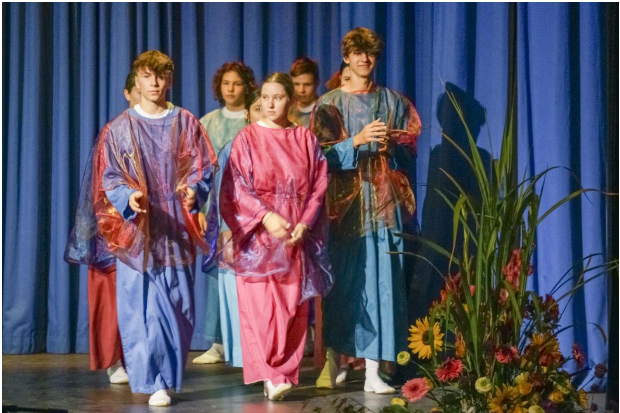
Eurythmieaufführung am Festtag unseres Schuljubiläums